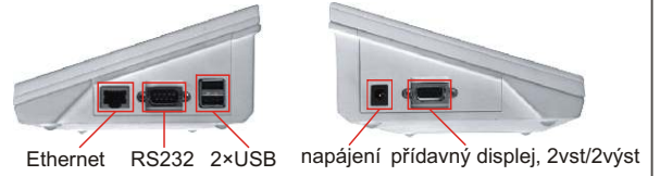
Ethernet RS232 2xUSB napájení přídavný displej, 2vst/2výst